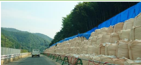
国道27号線真倉付近は片道開通