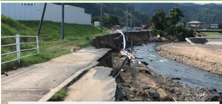
府道9号線大江町付近の現場